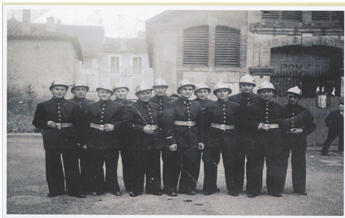
LES SAPEURS POMPIERS DE LIMOGNE 1949

Les activités opérationnelles des pompiers ont bien évolué depuis bientôt 70 ans et la demande de disponibilité également. Rappelons qu'à leurs débuts, les anciens n'avaient pas autant de matériels et d'engins et surtout de personnel. Ils réalisaient presque les mêmes interventions qu'actuellement.